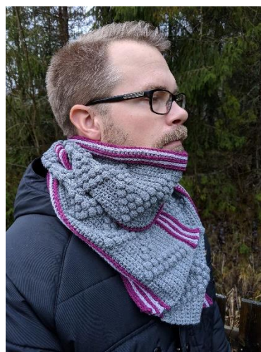
Garn Katia Atlantic x 5 nystan Virkat av Virkevira