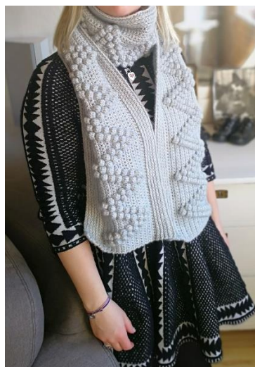
Garn Svarta Fåret Freja Färg 238 x 4, färg 01 x 1 och färg 16 x 1 Virkat av @karinnilssonysane